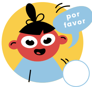
Decir "por favor"