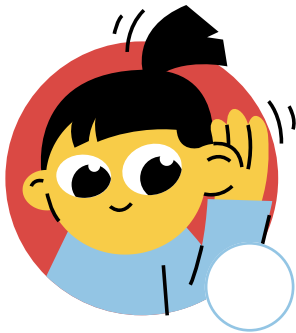
Escuchar durante la clase

¿Quién de los siguientes niños sigue las reglas del aula? Dales estrellas por un trabajo bien hecho.