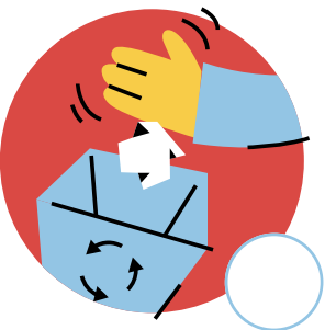
Tirar la basura en el bote de basura