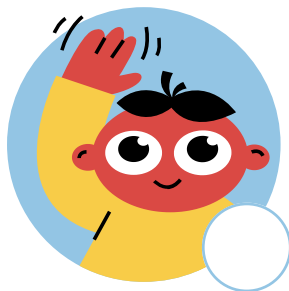
Levantar la mano para hacer preguntas