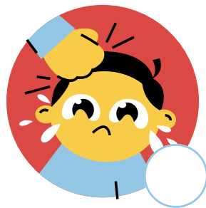
Lastimar a un compañero de clase