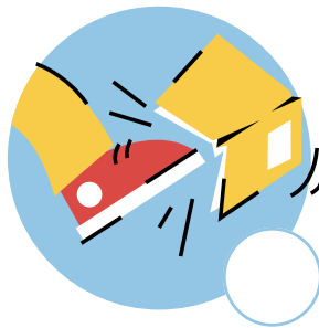
Hacer un desorden