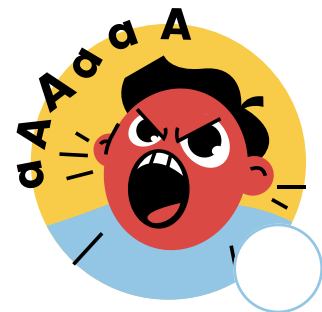
Gritar en clase